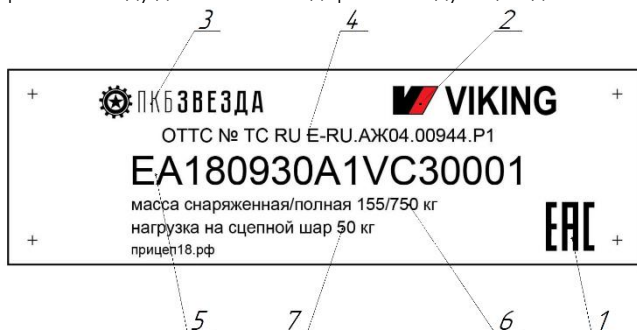
Рисунок 3: 1- знак обращения на рынке; 2- товарный знак; 3- наименование изготовителя; 4- номер Одобрения Типа Транспортного Средства на прицеп; 5- индикаторный номер (VIN); 6-Масса снаряженного транспортного средства / максимально допускаемая полная масса; 7- максимальная нагрузка на тягово-сцепное устройство;

Прицеп маркирован в соответствии с требованиями ТРОБКТС. Единый знак обращения продукции на рынке государств - членов Таможенного союза наносится в соответствии с Решением Комиссии Таможенного союза от 15 июля 2011г. №711. Табличка изготовителя (рис.3) расположена на правом лонжероне прицепа с правой стороны по ходу движения и содержит следующие данные: